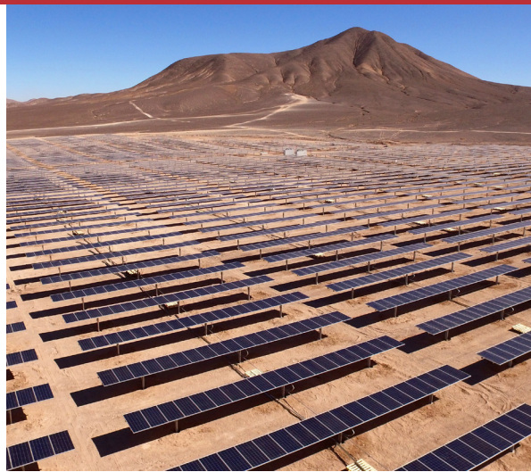
Billedtekst Neo Sans Pro Light 6/9pt. Excest, sunt dessimin electibea comnihitam, ut eumet vernatem voluptas inctem rate nos volupt turis con escium quam fugit utem quoditi excest, sunt dessimin aselectibea comnihitameumet vernatem voluptas inctem.

Rum eossitet qui doles est, sam asit eos molorum ut eosandel mod mi, quos imusa aborem rectem. eturibusci necuptus, tem que corepero ma cuEt as ci necuptus, tem que corepero ma cus quid ullaboresto tem niatend iandae audanis saniae iderecae elita sum corum, to cum.